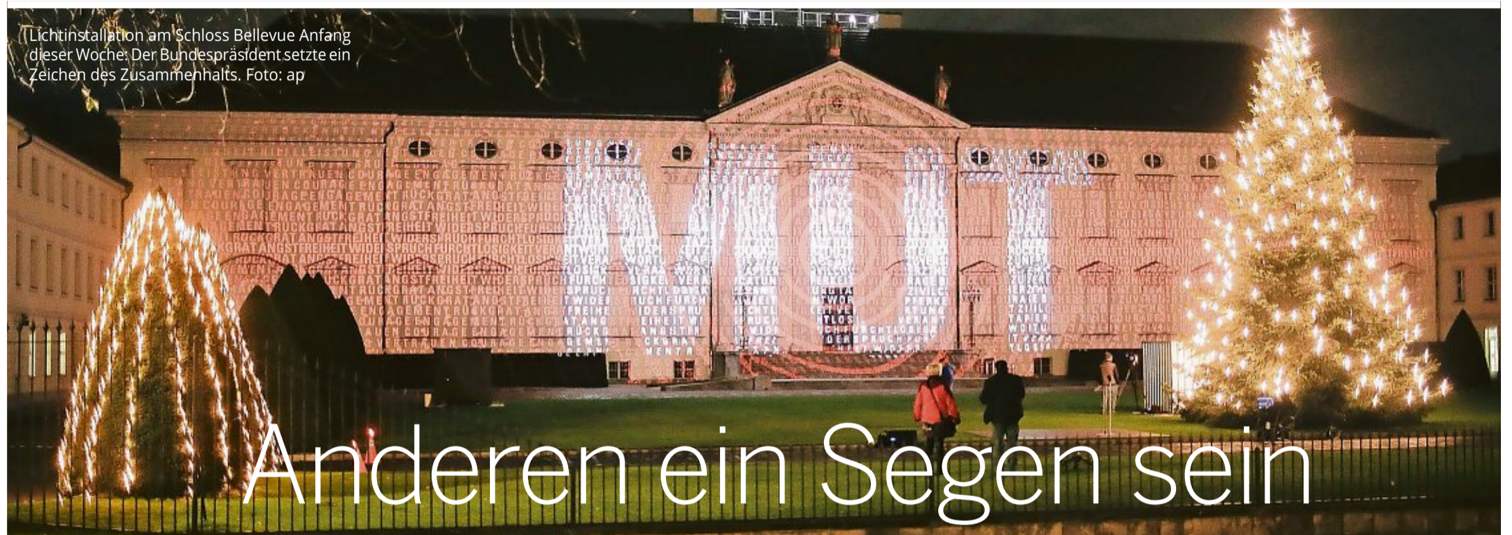
Lichtinstallation am Schloss Bellevue Anfang dieser Woche. Der Bundespräsident setzte ein Zeichen des Zusammenhalts.

Rundschau-Podium „Weihnachten versus Corona“ – Die außergewöhnlichen Umstände während der Corona-Pandemie bedeuten schmerzhaft eingeschränkte, aber auch Chancen